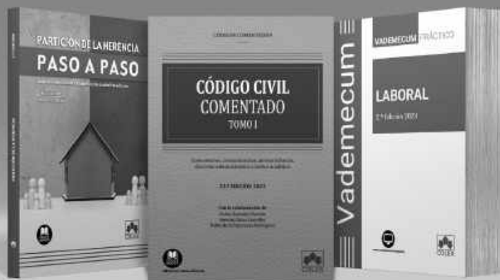
Paso a paso

LA EDITORIAL JURÍDICA DE REFERENCIA PARA LOS PROFESIONALES DEL DERECHO DESDE 1981