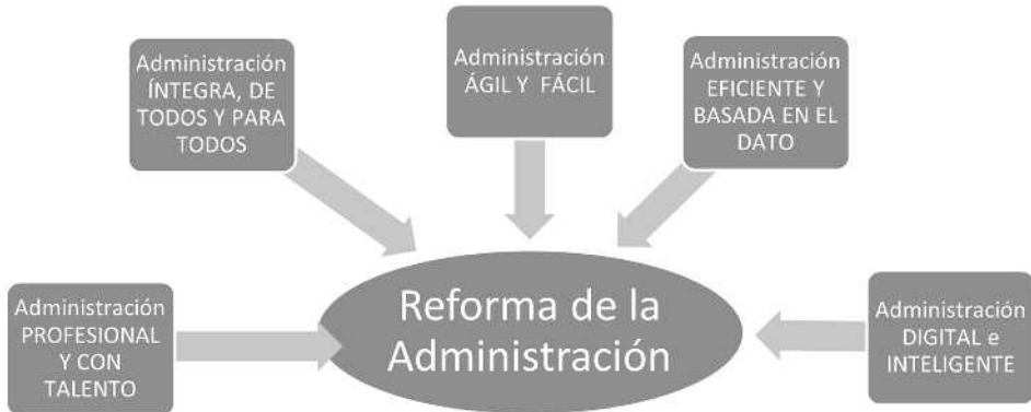
FIGURA 5. La reforma de la Administración

En cuanto la gestión de los recursos públicos, los ciudadanos desean que la Administración sea flexible y se adapte rápidamente a las necesidades, utilice de manera eficaz las herramientas necesarias para tomar buenas decisiones, colabore con quien sea preciso para atender los problemas, y gestione de manera íntegra y limpia los recursos (una Administración íntegra y eficiente). Para hacerlo posible necesita tecnología y talento.